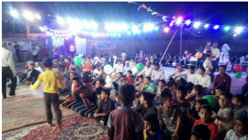
مراسم جشن عید غدیر و تقدیر از حافظان قرآن شهر رشتخوار