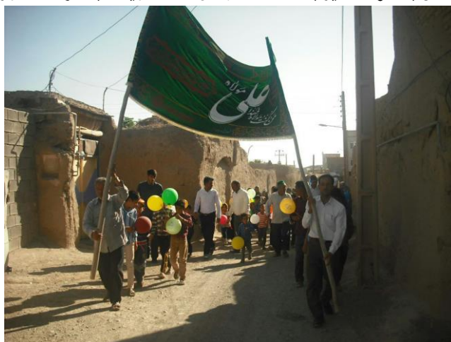
کاروان شادی غدیر در یکی از روستا های شهر رشتخوار