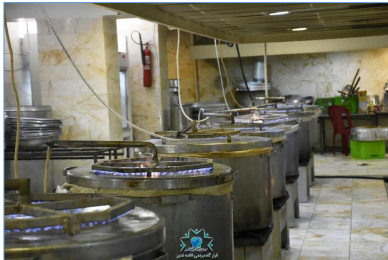
۱۴۰۰ پرس غذا امسال در آشپزخانه حسینیه سیدالشهدا ع در تهران طبخ و توزیع گردید

بیشترین رقم از کمک های مردمی بالغ بر ۵۳۵,۰۰۰,۰۰۰ ریال برای پخت تجمیعی بیش از ۵,۰۰۰ پرس غذا صرف گردید.